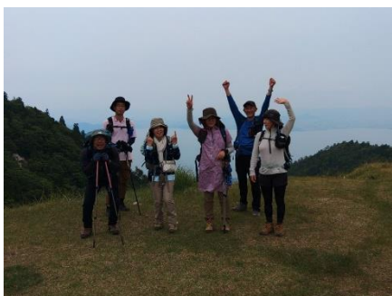
北比良峠から琵琶湖を見る