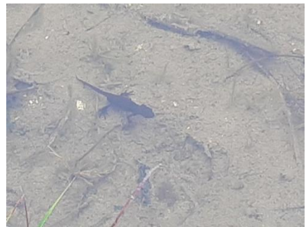
アカハライモリです