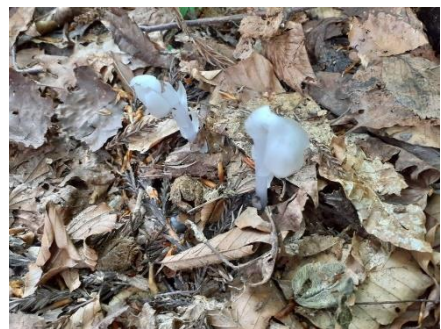
ギンリョウソウ・銀竜草・