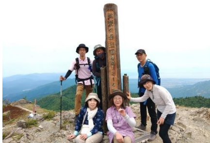
武奈ヶ岳山頂です